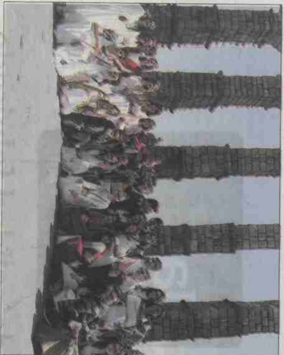
Grupos de alumnos de siete centros se congregaron ante el Acueducto.